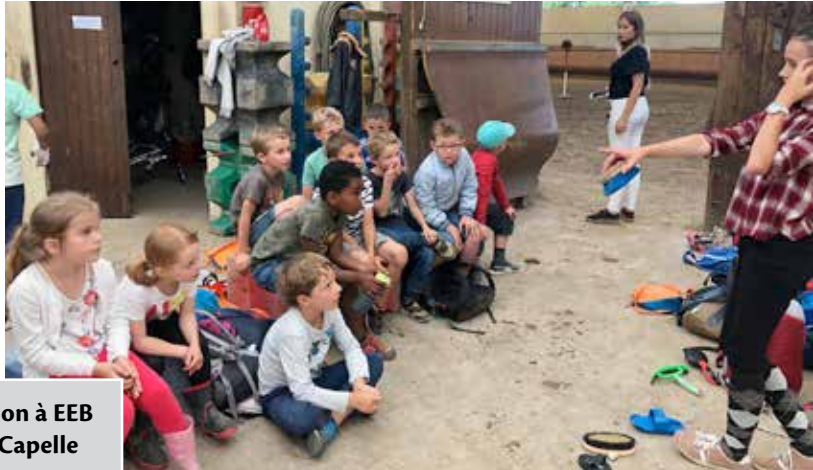
Equitation à EEB de La Capelle