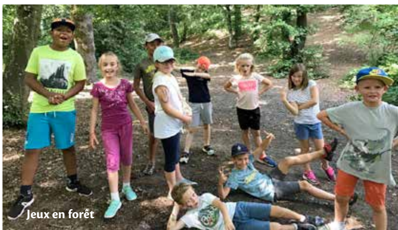
Jeux en forêt