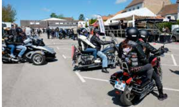
Rassemblement de la traditionnelle rétro capelloise organisée par le Comité des Fêtes