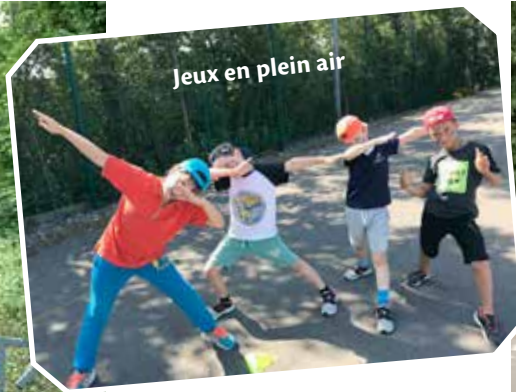
Jeux en plein air