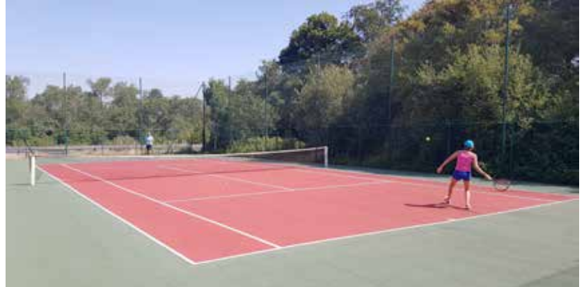
Le court de tennis derrière le terrain multisport a été rénové