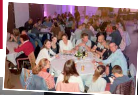
La sortie à Louvres Lens et Notre Dame de Lorette organisée par le CCAS