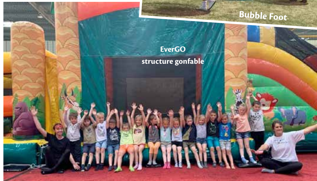
EverGO structure gonfable