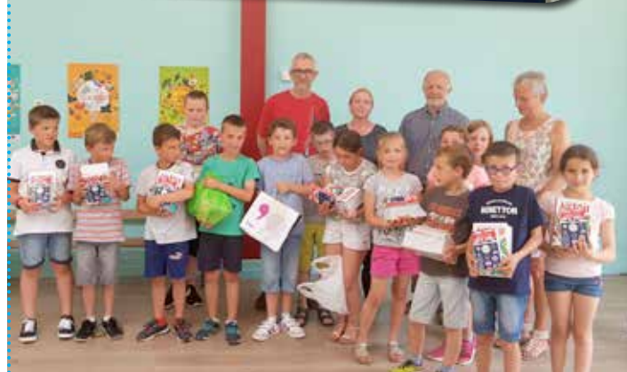
Le 26 juin, remise des dictionnaires aux écoles