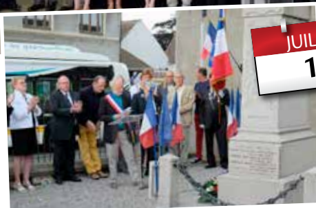
Cérémonie du 14 juillet 2019 , dépôt de gerbe au monument aux morts et remise des récompenses aux diplômés et médailles du travail.