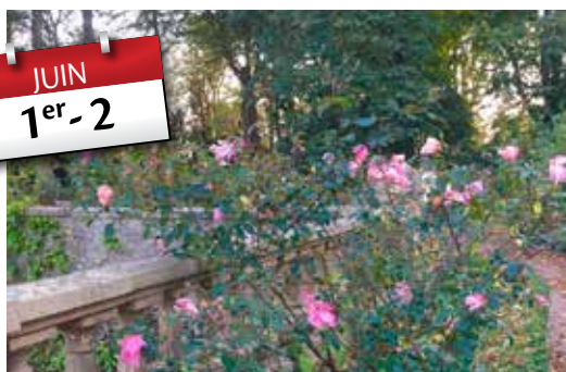
Toujours de nombreux visiteurs pour la fête des plantes et du Jardin du Château de Conteval.