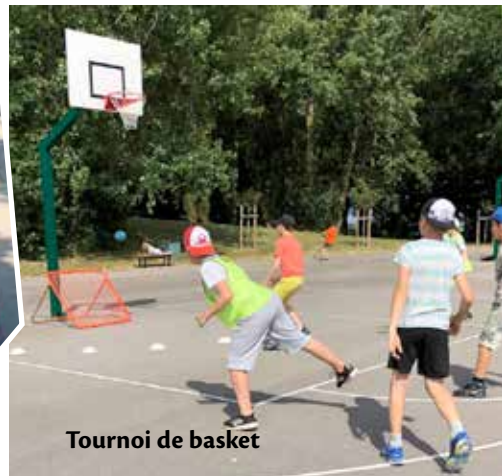
Tournoi de basket