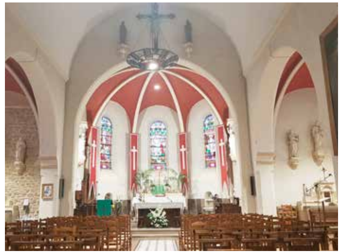
L'installation électrique de l'église a été rénovée et l'éclairage remplacé par des LED