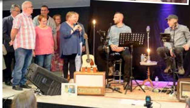
Soirée cabaret avec Manhole Cover au Centre Socio Culturel organisée par le Comité des Fêtes