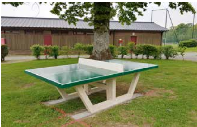
La nouvelle table de ping-pong