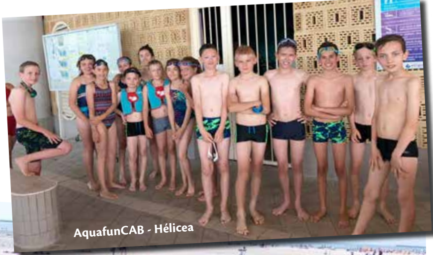
AquafunCAB - Hélicea