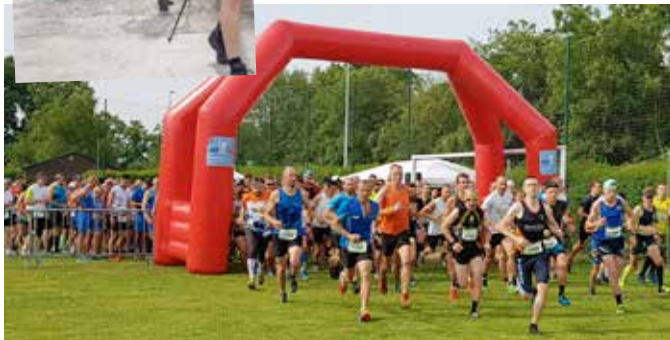
Carton plein pour le trail organisé par l'AC Capellois au camping « les Sapins ».