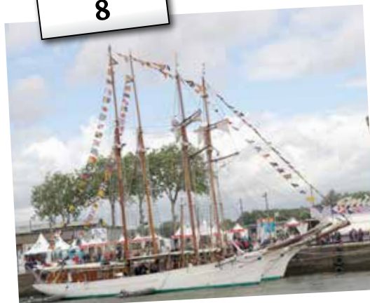
53 hardis moussaillons, Capellois et assimilés, ont rejoint l'Armada de Rouen en bravant les coups de tabac de la météo.

Merci pour la bonne humeur de l'ensemble de l'équipage !