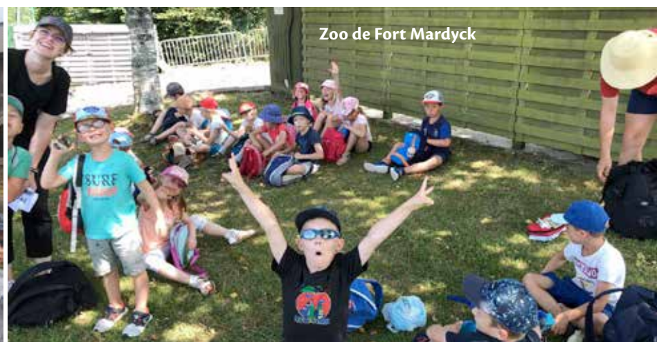
Zoo de Fort Mardyk